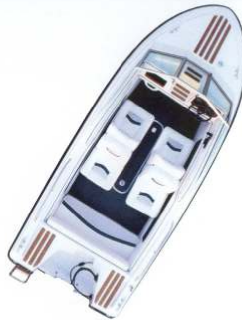
Sie haben die Wahl: Back-to-Back-Sitze und Rücksitzbank...