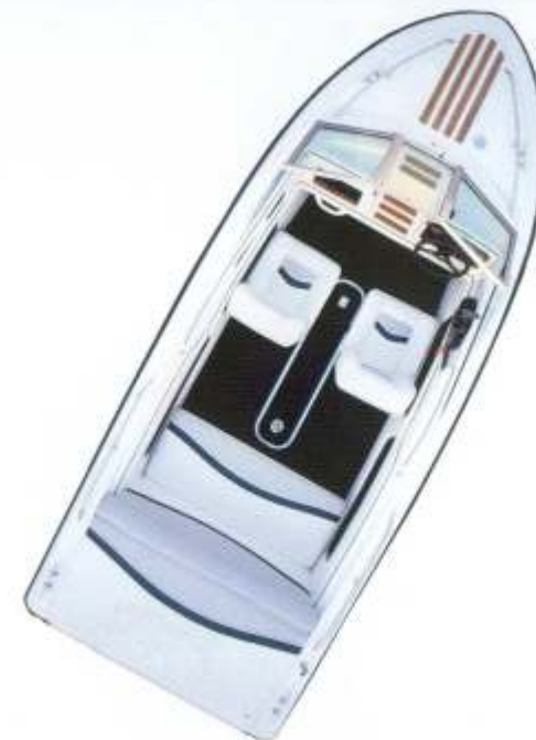
... oder Einzelsitze und große Rücksitzbank